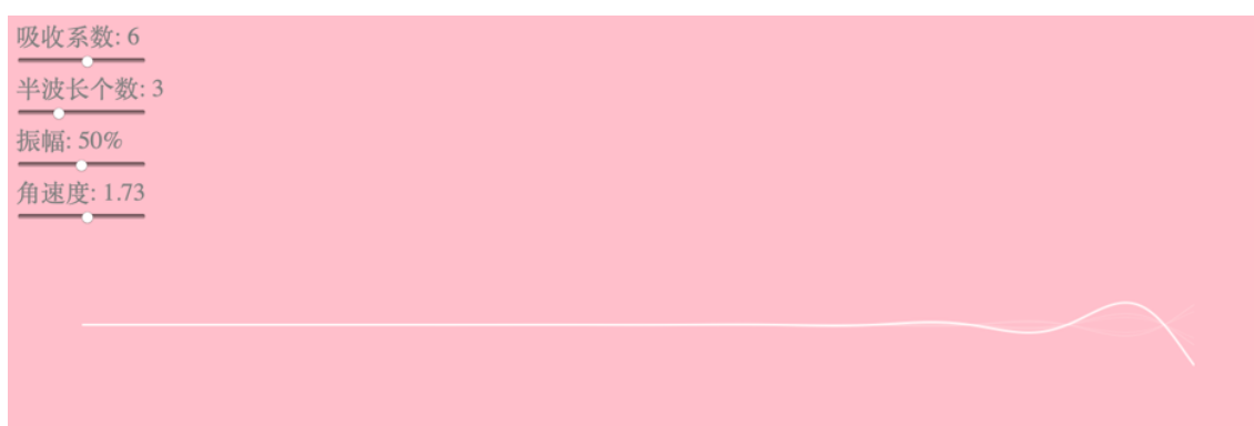
FIG. 5. 增加角速度: 相当于减小了波传播的周期, 截图无法看出变化, 但是动图可以看到波速变快。