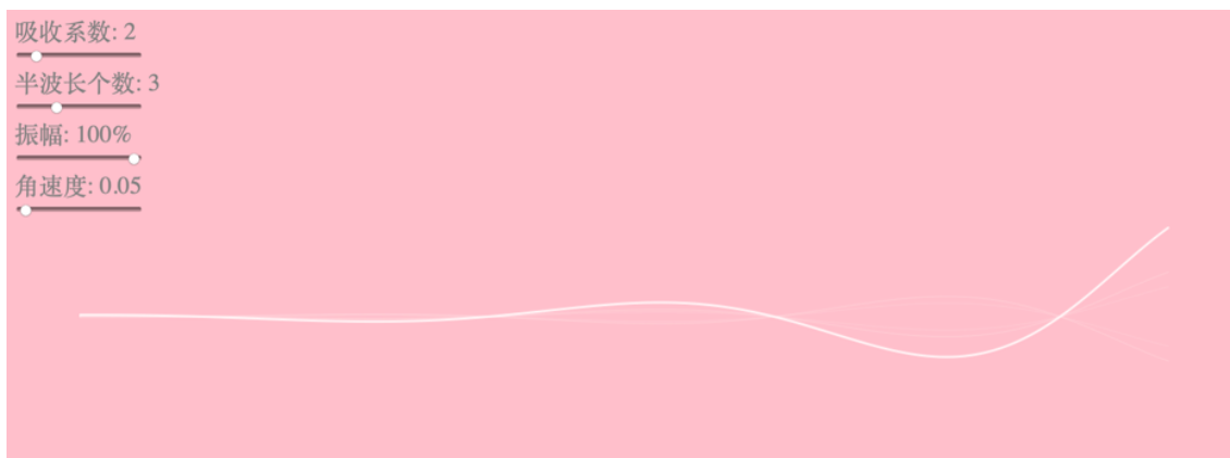
FIG. 1. 声波衰减的模拟图