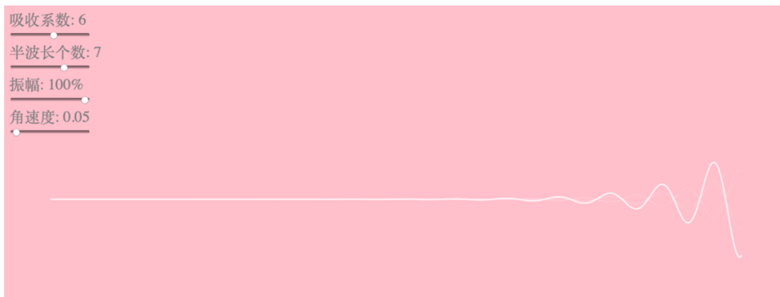
FIG. 3. 增加半波长数: 在实现过程中相当于改变了波的波长