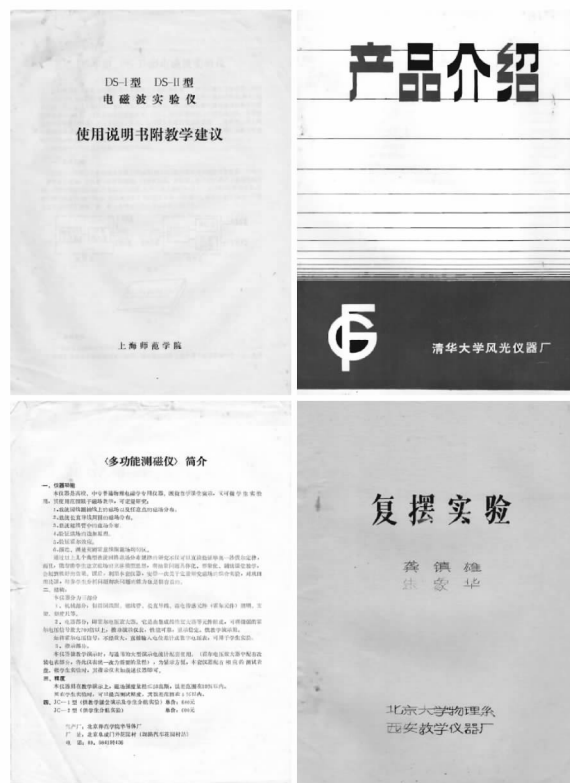
图4 “兰州会议”期间教学仪器厂商或教学单位(高等学校)展示或介绍所研发教学仪器说明书及其教学建议等

图5和图6分别给出了《全国综合性大学近代物理实验教学交流会论文集(一九八一年)》油印本