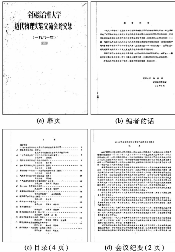
图 5 复旦大学物理教学实验中心收藏 1981 年交流会论文集 (油印本)

的扫描件和在交流会现场所拍摄的部分黑白照片, 这些资料均由复旦大学物理教学实验中心汪人甫老师收藏且提供。