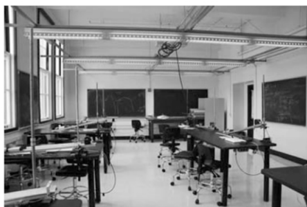
图 8 UCB 的基础物理实验室的具体布局