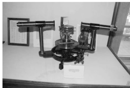
图 5 约翰霍普金斯大学 1902 年所使用的分光计

笔者所访问的几所大学的物理系均有很强的科学研究背景,一走进物理学系所在的大楼里面,能够马上感受到该院系的学术氛围和学术传统. 以 JHU 为例,他们有较强的光学和天文学背景,在大厅中央陈列的是 19 世纪所使用制作光栅器件的机械设备和 1902 年所使用的分光计(如图 5 所示),而在另一处则陈列着他们所制作的哈勃望远镜上使用的一个主要光学部件的模型. 哈佛大学在大厅陈列的是世界上第一台军用计算机.