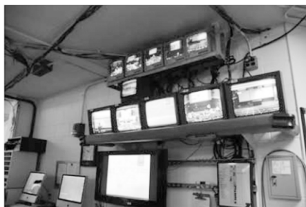
图1 哈佛大学的多媒体技术服务中心

讲课采用的是大课堂教学(300~500人)阶梯教室,课堂一般配置6~9块大黑板,2个大屏幕投影和1个超大屏幕投影.有专门的摄像工作人员,负责将各块黑板投影到大屏幕上.在物理演示实验的过程中,如果课堂演示的设备过小,也有专门的摄像机拍摄演示实验并投影到大屏幕上.摄像工作人员也在后台编辑摄像(如图1所示),课后剪辑好放置在学校网站供学生预习或者复习使用.