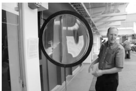
图 6 哈佛大学走廊陈列的“水透镜”