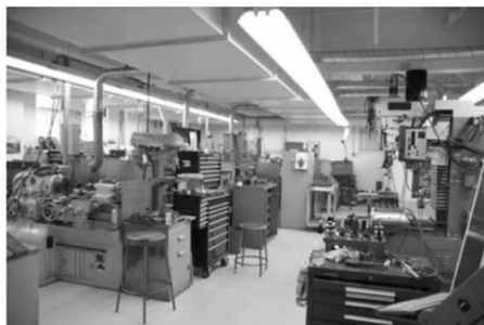
图 4 UCB 的金工车间