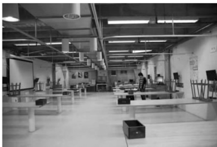
图 7 JHU 的普通物理实验室(位于地下室)的布局

各所大学的物理实验室及教室均设计得相当好,据了解是在实验室方案的具体设计阶段中反复推敲过而确定下来的,与中国的大学教学实验室相比的几个特点在于:1)实验教室比较集中,布局有序合理,而且相当大,空间上非常宽敞,教室里面往往仅有几张大桌子(如图 7 所示). 2)楼层特别高,所有管道和电缆都在上方裸露,房间从不吊顶,电线和网线通过上方垂直下放铺设(不怕漏水),可以根据情况随时调整实验室布局(如图 8 所示). 3)教室周围是一系列的实验柜子,各类常用的仪器分类合理整洁,每间教室都有大量的各类导线悬挂在墙上供学生选用. 4)拥有大量的供 10 个人左右讨论的小教室,往往是大教室通过简