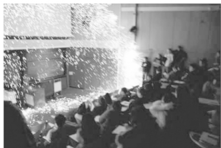
图 3 哈佛大学课堂上演示实验绽放的“礼花”

课堂演示实验所涉及到的几个要素在于“硕大”、“新奇”和“暴力”,特别能够吸引学生的注意力和引起学生主动思考。笔者印象最深的一次是在 Harvard 的课堂上,教授们利用 1 个超大的充电电容,将 1 根直径约 0.5 cm,长 30 cm 的金属丝瞬间击穿,在课堂里面放了一朵“大型礼花”(如图 3 所示)。如此惊人的演示实验,配合 i-Click 的提问环节,可以极大地调动学生的积极性。学生非常乐于在提问后与身边的同学相互之间讨论 5 min 后并投票。也有的教师往往将特别新奇的实验在课程结束前提出,让学生在课后继续思考,或者是告诉学生通过阅读后面课程的某一章节去解释这一现象,从而学生往往能够有的放矢,带着疑问去快乐地学习。